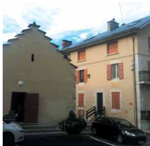
Rose pour la place des Martyrs

Toiture : gris bleuté Façade : ocre beige rosé Menuiseries : vieux rose Encadrements pierre : blanc