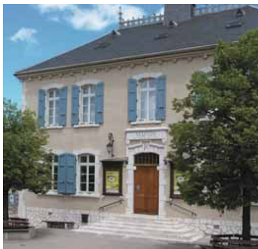
Bleu pour la place de la Libération

Toiture : gris bleu Façade : ocre beige Menuiseries : bleu moyen Encadrements en "saillie" : blanc