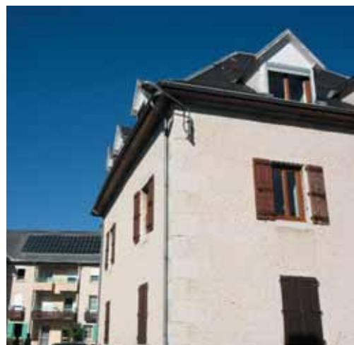
Vert pour la place des Bessonnets

Toiture : gris bleu Façade : ocre Menuiseries : marron Encadrements fins : blanc