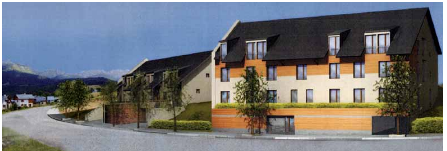
Vue du projet depuis le bas, à l'ouest du chemin de Combe Pourouze

Pour l'acquisition d'un des 5 terrains à bâtir, contacter directement la société HLM Pluralis Voiron au 04 76 67 24 24.