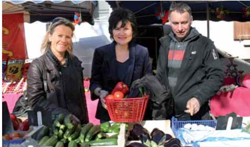
Le 18 mars dernier, le marché du mercredi s'est déplacé, à titre d'essai, au cœur du village.