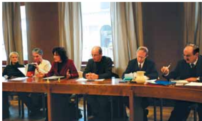
Réunion avec les entreprises locales et les banquiers