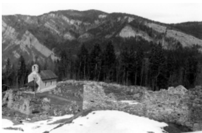
Le village de Valchevrière