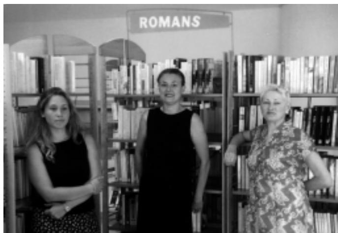
3 sourires à la bibliothèque Georges Pérec

Nous n'en sommes qu'à l'ébauche de la première liste proposée. »