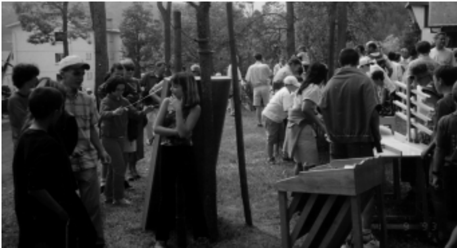
Première fête des Rhodos dans le parc ouvert au public au cœur du village.