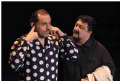
Spectacle de Dau et Catella

20 ans, 250 spectacles, 400 artistes, 300 professionnels, 36 000 spectateurs, 1 300 bénévoles, 2 000 articles, reportages, interviews, ou encore 1 tonne de nourriture, 3 000 litres de vin, 40 000 km, 200 réunions, 5 présidents, 4 maires... Retour sur la petite histoire du festival.