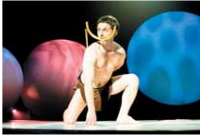
Spectacle d'Éric Bouvron

Défi relevé par la troupe des "Kes'Kons", soutenue dans la logistique par la MPT de Villard de Lans. "La nuit du café théâtre" s'organise en novembre 1989. Cette nouvelle initiative connaît une véritable ovation, la salle de la Coupole ne désemplit pas de la nuit !